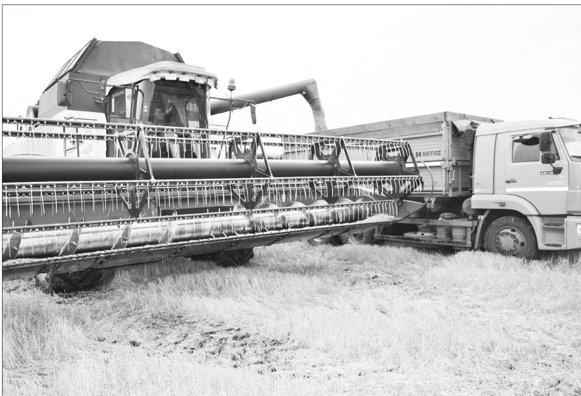
Завершается уборка пшеницы в ООО «ВосходАгро»

В один из погожих дней, 26 октября, мы приехали к аграриям ООО