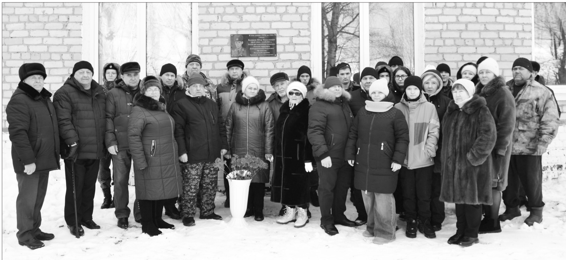
Памятное фото участников торжественного мероприятия